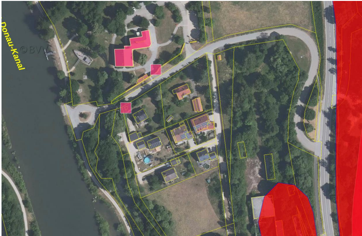
Abbildung 4: Bau- und Bodendenkmäler Gösselthal