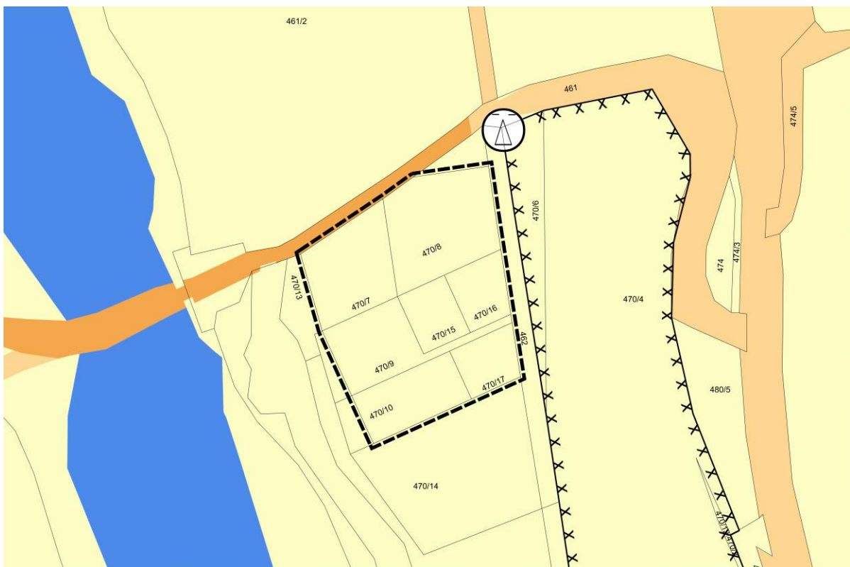
Abbildung 1: Ausschnitt Flächennutzungsplan Stadt Beilngries, ohne Maßstab

Die Stadt Beilngries verfügt über einen wirksamen Flächennutzungsplan (Bekanntmachung 06/1996). Im Flächennutzungsplan wird das Plangebiet als landwirtschaftlich genutzte Fläche dargestellt.