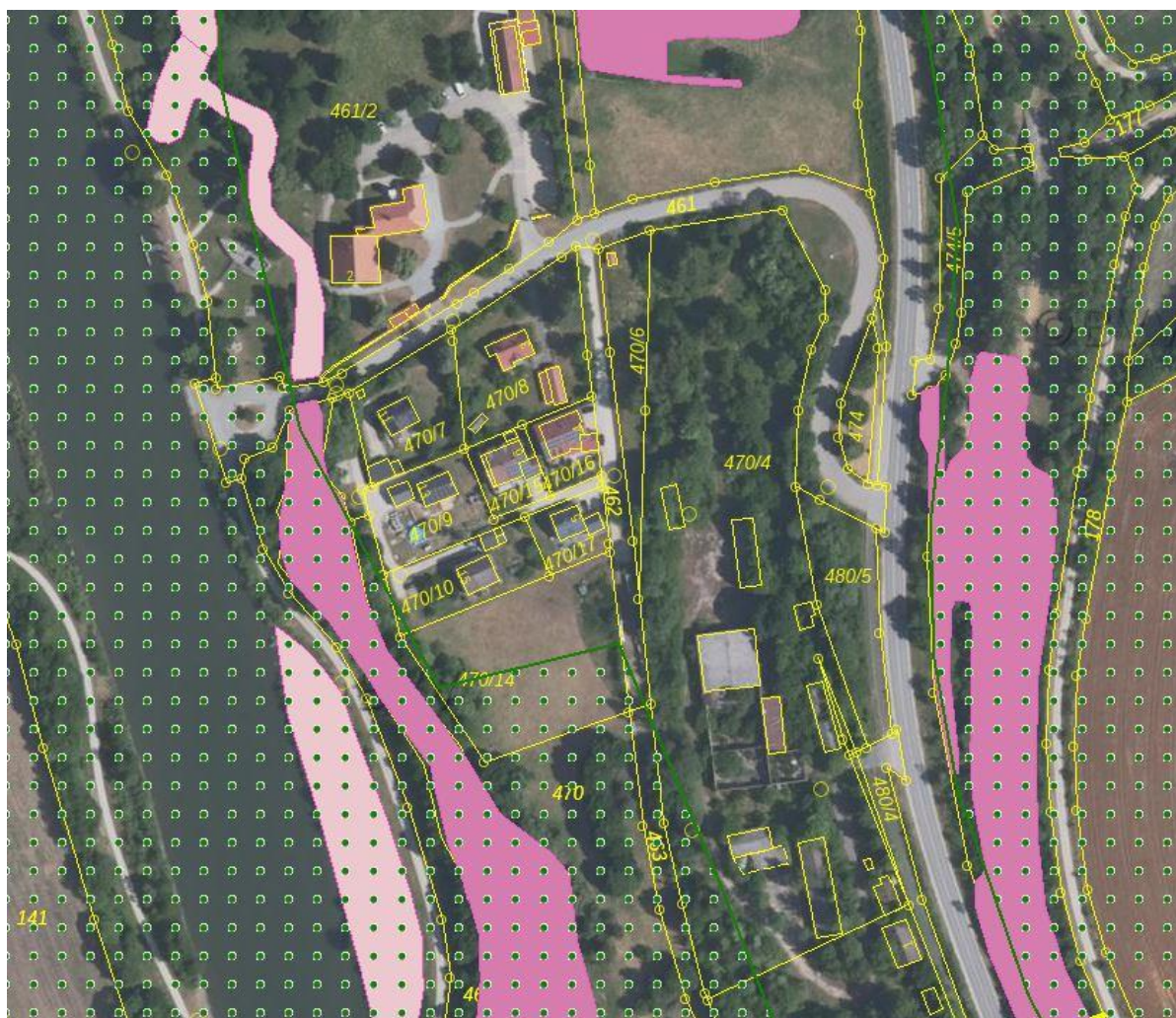
Abbildung 2: Schutzgebiete und Biotope im Umfeld von Gösselthal