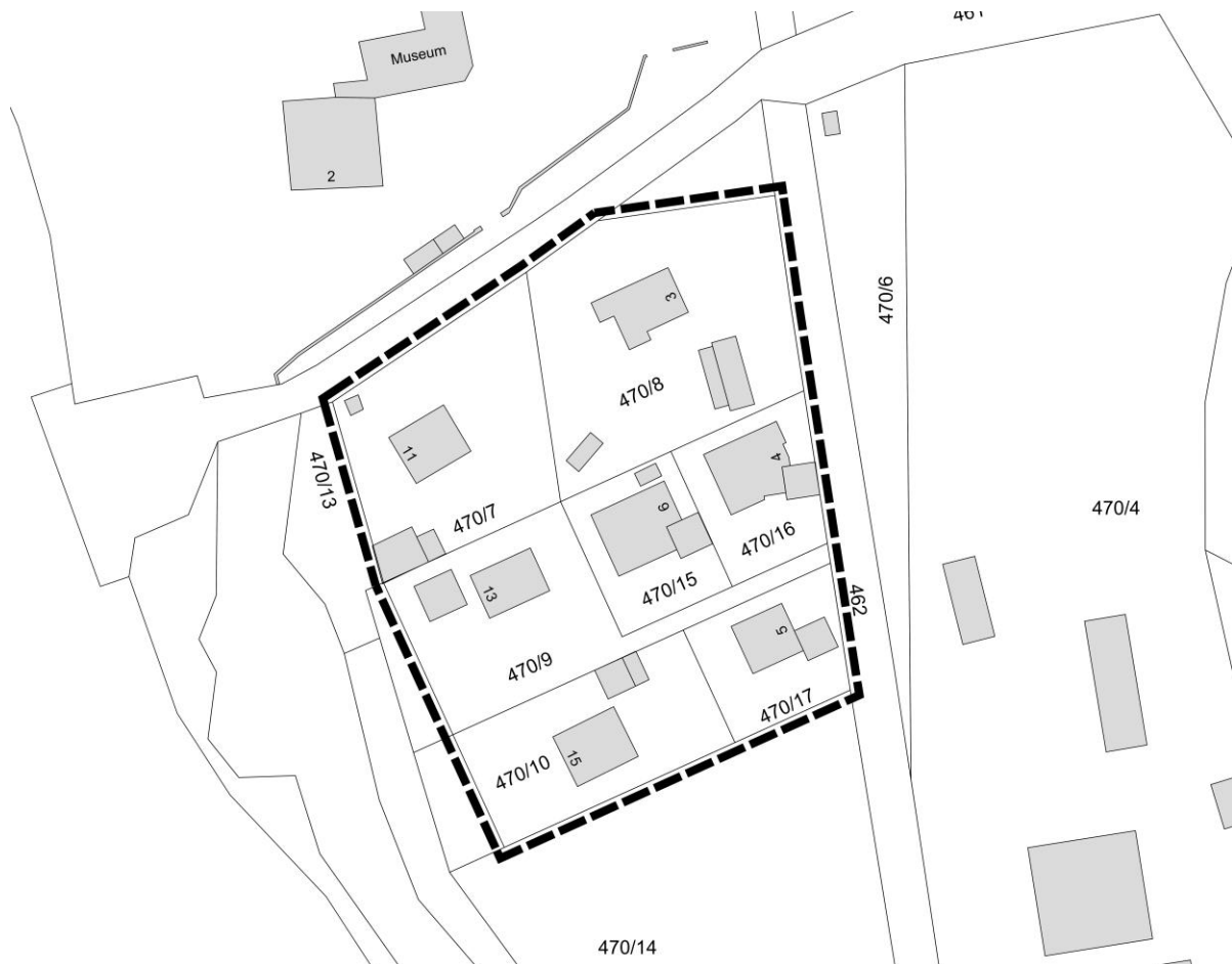
Abbildung 5: Lageplan Geltungsbereich der Außenbereichssatzung, ohne Maßstab

Der Geltungsbereich der Außenbereichssatzung Nr. 125 „Gösselthal“ umfasst die Grundstücke Fl.Nrn. 470/7, 470/8 (Teilfläche), 470/9 (Teilfläche), 470/10 (Teilfläche), 470/15, 470/16 und 470/17 der Gemarkung Biberbach. Die Fläche beträgt ca. 0,7 ha.