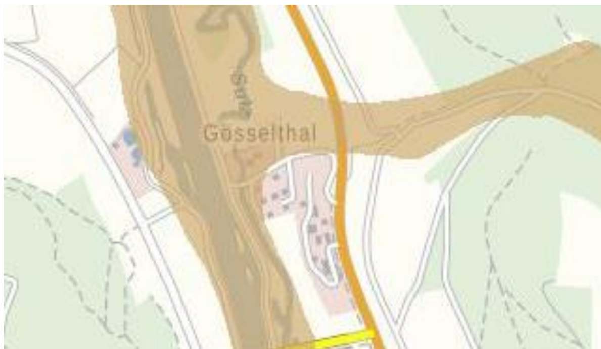
Abbildung 3: Wassersensible Bereiche (Braun) im sowie im direkten Umfeld des Plangebietes (Rot) [BayernAtlas, 2024]

Ein Teil des Plangebietes liegt innerhalb von Flächen, die als wassersensibler Bereiche festgesetzt sind. Die Ausweisung der wassersensiblen Bereiche reicht teilweise im Westen leicht bis in das Plangebiet.